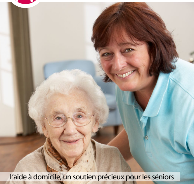
L'aide à domicile, un soutien précieux pour les séniors

Soutien renforcé aux associations d'aide à domicile pour des salariés mieux payés et mieux formés et extension du dispositif « Du 47 dans nos assiettes » aux EHPAD pour offrir à nos aînés des repas de qualité et de proximité