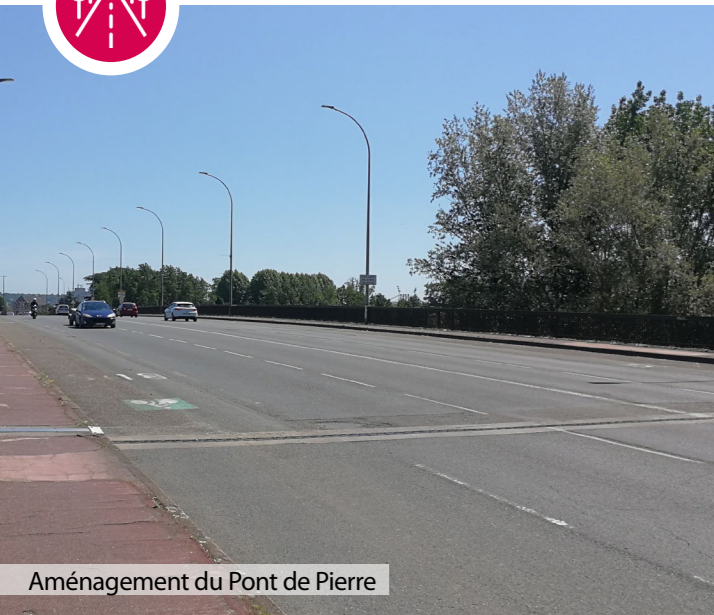
Aménagement du Pont de Pierre

Modernisation du réseau routier avec notamment la réalisation du barreau et du pont de Camélat et l'aménagement de la RN21, la mise en service du nouvel échangeur d'Agen (18 Millions d'euros d'investissement)