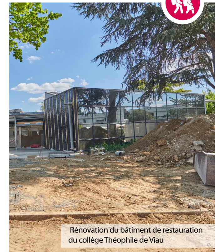
Rénovation du bâtiment de restauration du collège Théophile de Viau

Création d'un « chèque-asso » de 50 euros proposé aux collégiens sur critères sociaux afin de s'inscrire à un cours de théâtre, de danse, de musique ou de prendre une licence dans un club sportif lot-et-garonnais