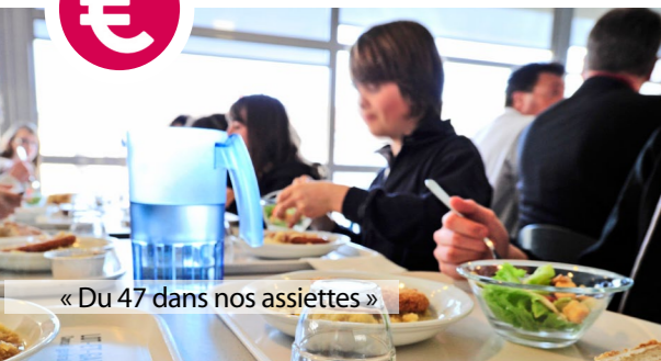
« Du 47 dans nos assiettes »

Diminution de 30 % du prix du repas dans les collèges