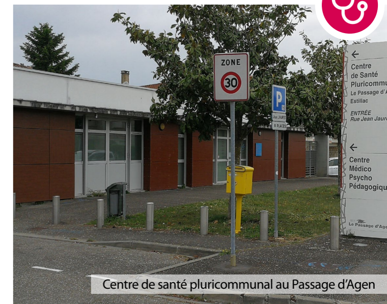
Centre de santé pluricommunal au Passage d'Agen