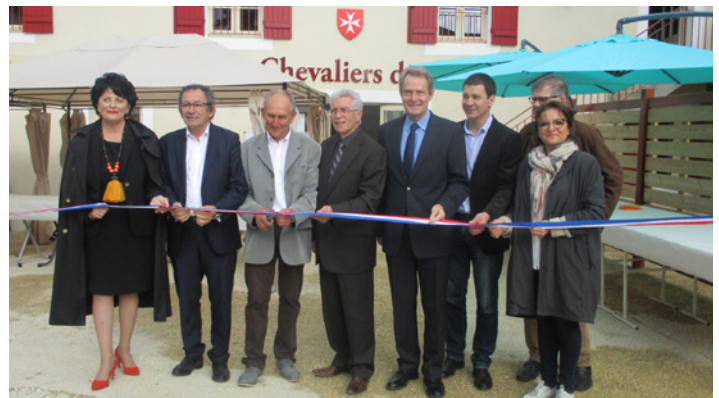
Le soutien à la ruralité : inauguration du commerce du Nomdieu