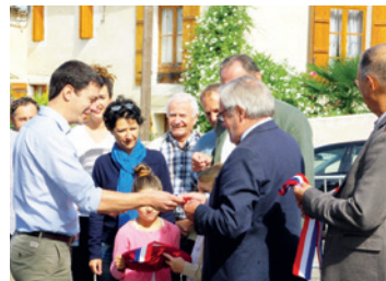
Le forum des associations à Mézin