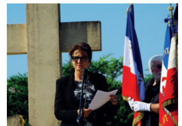
Le devoir de mémoire, tous les ans, au mémorial de Gueyze