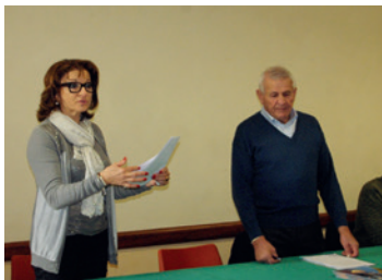
De nombreuses assemblées générales, une vie associative dense