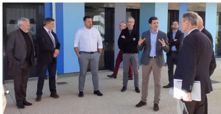
Agrinove pour l'emploi de demain, l'innovation dans l'agriculture et la promotion de l'Albret

> Nous soutiendrons les projets de modernisation du musée-Château Henri IV à Nérac, du musée du liège à Mézin et d'autres projets similaires qui pourraient voir le jour sur d'autres communes.