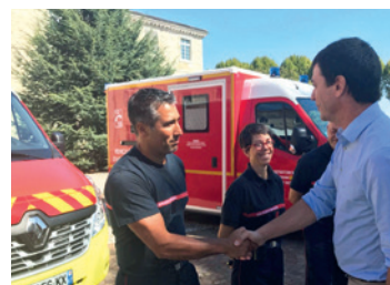
Nos casernes sont équipées