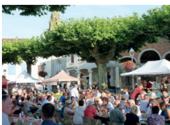
Le Marché d'été de Sos. Mais aussi Lamontjoie, Nérac, Francescas, Mézin