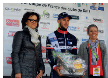
Le tour du 47 en Albret