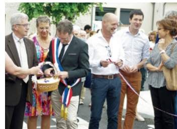
Inauguration des travaux à Saint-Vincent-de-Lamontjoie