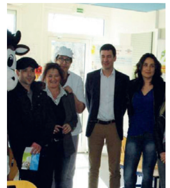
Du 47 dans nos assiettes : faire manger local à nos collégiens