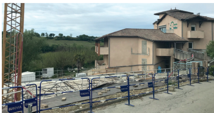
Les travaux de l'EHPAD de Sos ont commencé