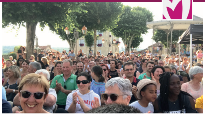
L'Albret, terre de convivialité