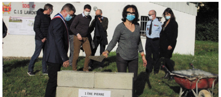
Extension de la caserne de Lamontjoie : un soutien sans faille à nos pompiers