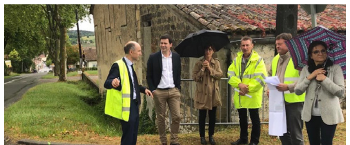
Visite des travaux routiers en Albret avec la Présidente