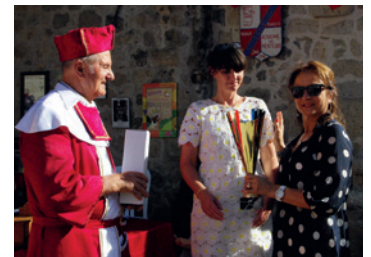
L'Albret, terre de tradition Les menteurs de Moncrabeau