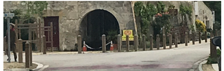
Traversée de bourg de Poudenas, un exemple de projet accompagné par le Département