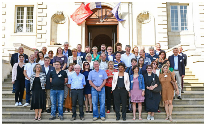
Le Conseil consultatif citoyen : 42 citoyens tirés au sort pour donner leur avis