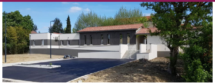
L'école de Francescas : exemple d'un projet communal subventionné par le Département