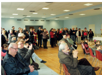
Le rituel des vœux dans les communes