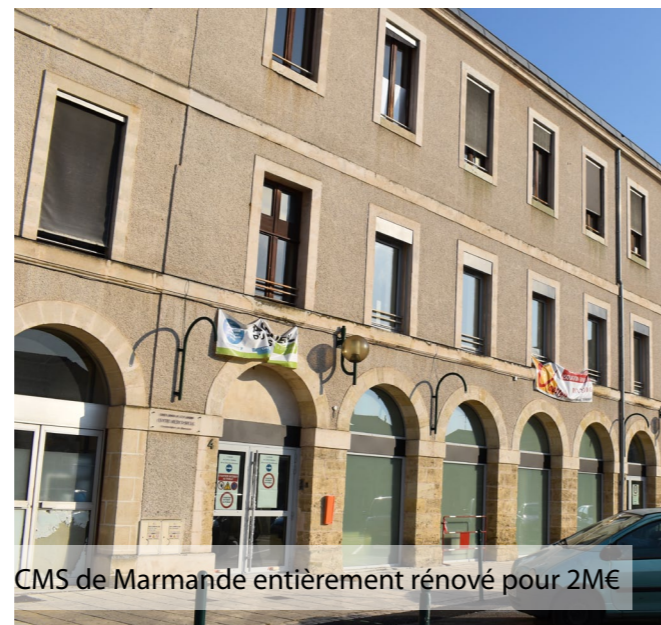
CMS de Marmande entièrement rénové pour 2M€

Pour bien vieillir autrement, soutien à la création