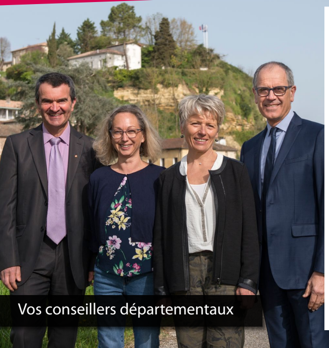
Vos conseillers départementaux

C'est un élu qui a une double mission : il représente son canton et ses habitants au sein de l'assemblée départementale. En cela il soutient les projets, les initiatives des communes du canton aussi bien que ceux du monde économique et associatif. Il exprime les besoins et les attentes des habitants du canton et du territoire. Il doit pour cela rester proches des gens. Mais « se montrer partout » n'est pas le gage d'une réelle proximité. Il faut surtout avoir la confiance des acteurs et notamment des maires de son canton. L'essentiel est de savoir écouter, de prendre en compte et d'avoir la capacité à aller chercher des solutions au Département. La deuxième mission est de participer, à Agen, au sein d'une majorité départementale à la définition des projets et de porter au niveau cantonal les politiques publiques qui en découlent. L'efficacité d'un binôme d'élus se mesure donc à participer dans une équipe majoritaire, à trouver des réponses aux enjeux et à construire des politiques publiques au service du territoire et de tous ses habitants. Nous, nous assumons cette action collective en portant, avec la future équipe majoritaire un programme solidaire, ambitieux et financièrement réaliste.